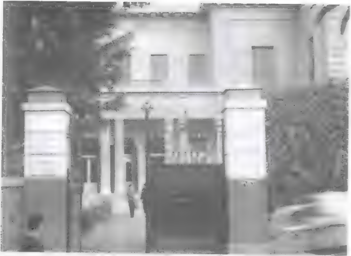
لوير خارجاً من قصر المنيرة الذي أصبح "المعهد الفرنسي للآثار الشرقية"